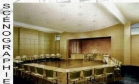
HÔTEL DE VILLE A ST-ETIENNE DU ROUVRAY

2002 à 2007 : Dessinateur Projeteur - Saint Barthelemy (Antilles) bureau d'études d'architecture / C.A.O. (2D/3D) 1997 à 2001 : Dessinateur Projeteur / Infographiste - Paris ACORA / architecture / scénographie C.A.O. et D.A.O., responsable du parc informatique, gestion des archives. 1989 à 1992 : Barman (emploi saisonnier), à l'Alpes d'Huez Tenue du bar, de la caisse, accueil des clients et des représentants. 1985 à 1987 : Chef de rayon (rayon fruits et légumes), S.A.S.M. Gestion de stock, inventaire, animation de l'équipe de travail (5 pers). 1984 à 1985 : Vendeur (rayon fruits et légumes), S.A.S.M.