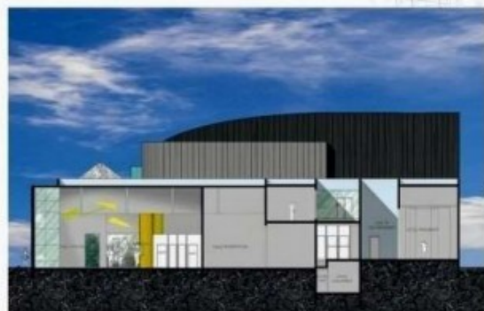
APPARTEMENT A GUSTAVIA